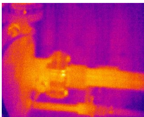
ポンプの温度異常を計測