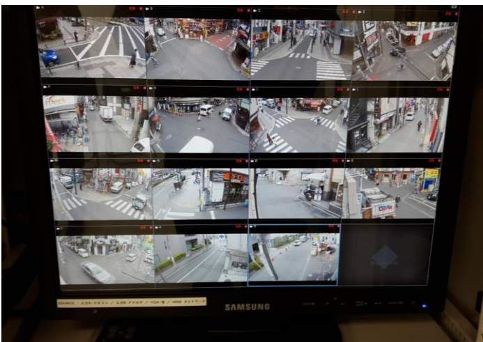
防犯カメラモニター

インターディメンションズが納入した 16 台の防犯カメラは、JVC ケンウッド製の赤外線 LED 照明器搭載、高精細フルHD 出力対応のモデルで、車のナンバーが識別できる程解像度が高い上、昼夜問わず撮影が可能で、警察からも高い評価を得ています。録画データは最長 1 ヶ月間保存し、警察から依頼があった時には仙台中央地区環境浄化対策協議会が評議の上、提供します。また、防犯システムは通常電話回線を使用しますが、町内全域にネットワークを組んで構築したことによりランニングコストがかからず、コスト削減にも寄与しました。宮城県内の商店街に防犯カメラを設置する取組みは本件が初めての試みであり、今後の展開が期待されます。