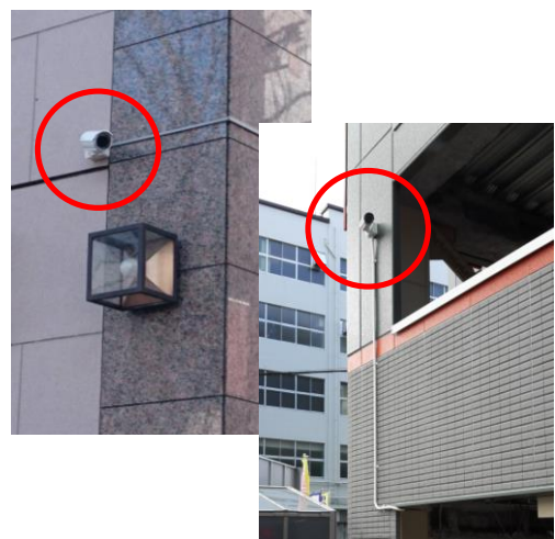
国分町地区に設置した防犯カメラ

ソルクシーズグループでは、「ストックビジネスの拡大」を事業戦略の一つにしておりますが、今回の防犯カメラシステム関連事業はその一環です。今後も、防犯カメラ等のセキュリティシステムの環境整備を通じ犯罪の抑止に繋がると共に、地域社会の発展に貢献してまいります。